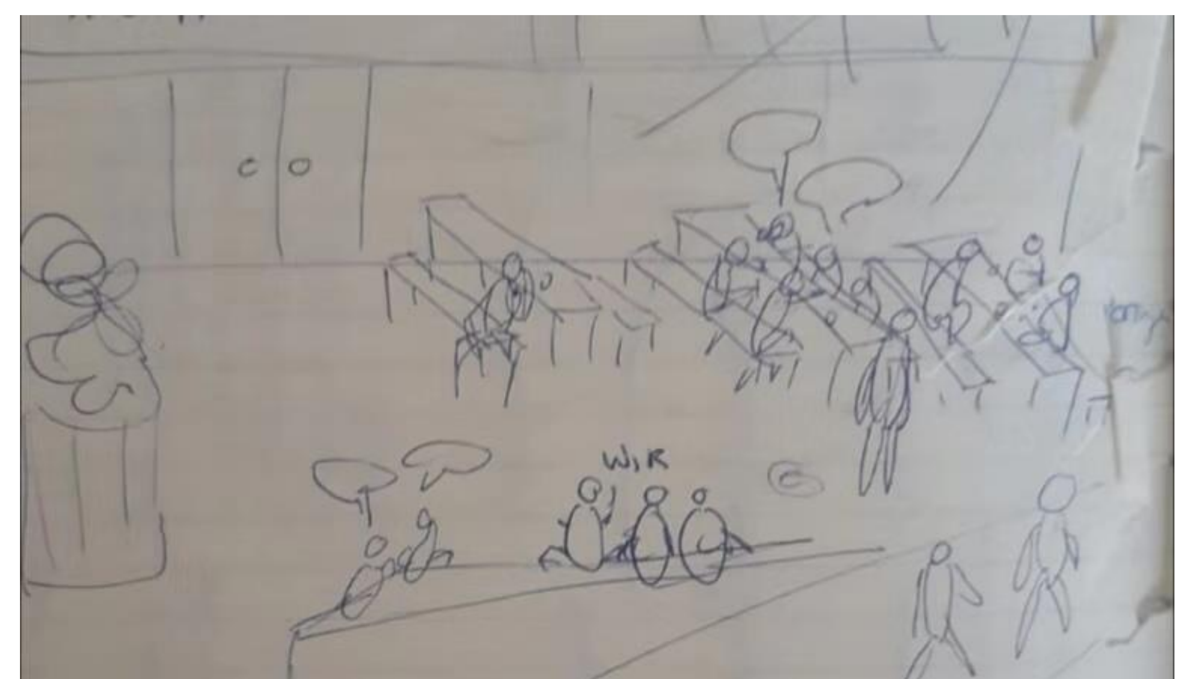
Gemeinsame teilnehmende Beobachtung vor der Mensa im Institutsviertel (Skizze: Sophie Kienlein-Zach)

Studieninteressierte Geflüchtete führen gemeinsam mit Studierenden der Ethnologie empirische Übungsforschungen zu akademischen Kulturen an der Albert-Ludwigs-Universität durch