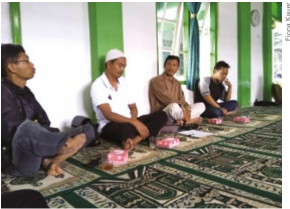
Bertemu dengan anggota Jejaring | Ein Treffen der Mitglieder des Netzwerkes